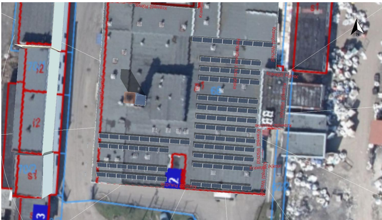
Rys 1. Mapa – dz. nr 68 ; 69 ; 70/1 ; 70/2 obręb 320101_10005 miasto Białogard

Projektuje się system składający się z 110 szt. paneli fotowoltaicznych montowanych na konstrukcji wsporczej balastowej. Orientacja systemu na południe. Panele lokalizuje się uwzględniając ustawienie najbardziej korzystne pod względem uniknięcia zacienienia oraz możliwości największego uzysku energetycznego.