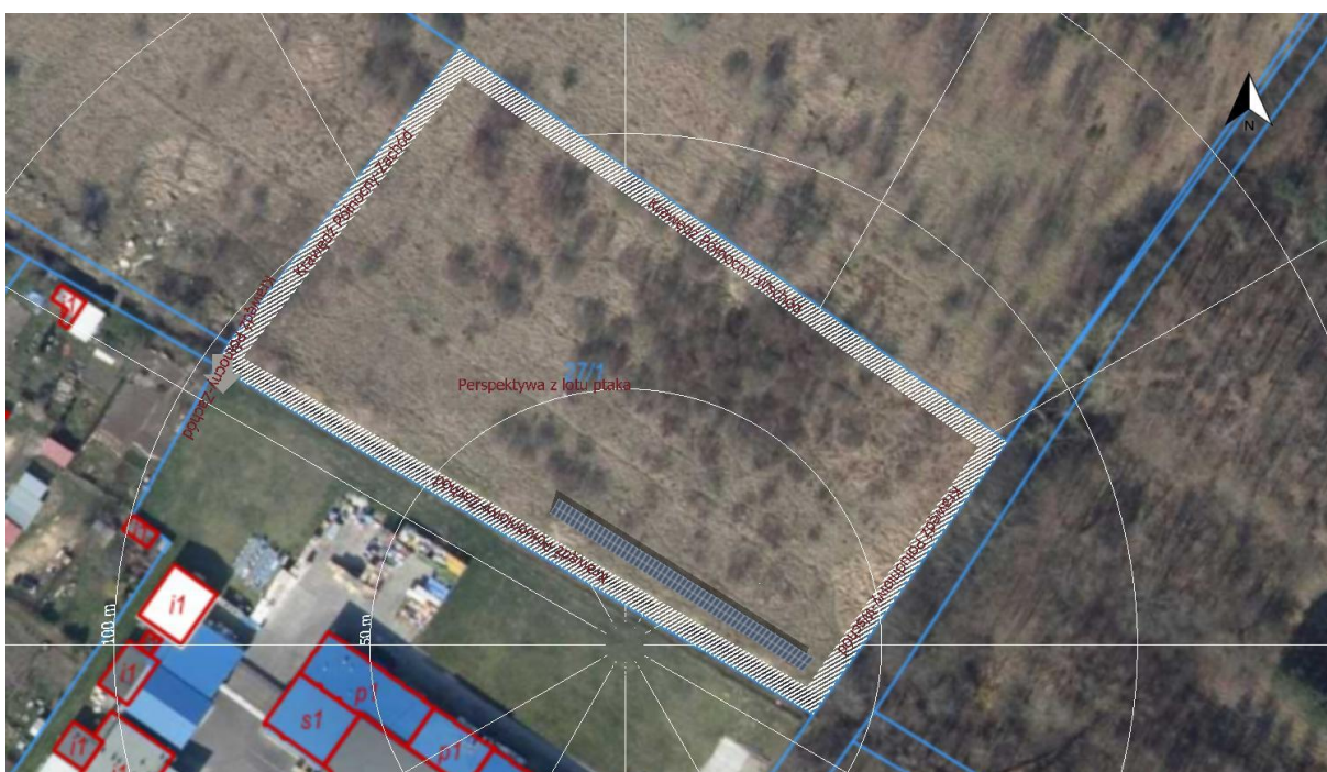
Rys 1. Mapa – dz. nr 27/1 ; 27/2 obręb 320101_10004 miasto Białogard

Projektuje się system składający się z 110 szt. paneli fotowoltaicznych montowanych na konstrukcji wsporczej. Orientacja systemu na południe. Panele lokalizuje się uwzględniając ustawienie najbardziej korzystne pod względem uniknięcia zacienienia oraz możliwości największego uzysku energetycznego.